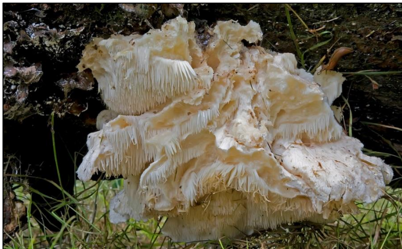
Slika 30. Creolophus cirrhatus

Plodište je do 8 cm veličine, jednogodišnje, konzolasto, polukružno ili lepezasto. Površina je bijela, neravna i prekrivena sterilnim izraštajima. Javlja se na mrtvom drvetu lišćara, a naročito bukve. Rijetka vrsta i vrijedna zaštite.