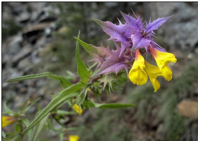
Slika 15. Melampyrum hoermannianum (Šarić, 2018)

Vrsta poluparazita koji od biljke-domaćina dobivaju vodu i hranjive tvari, ali one mogu i same preživjeti bez ovakvog parazitiranja. Stabljika je uspravna, visine do 50 cm. Listovi su nasuprotni, zašiljeni, zelenkaste do ljubičaste boje, a nalaze se na vrlo kratkim peteljka. Cvjetovi su žute boje.