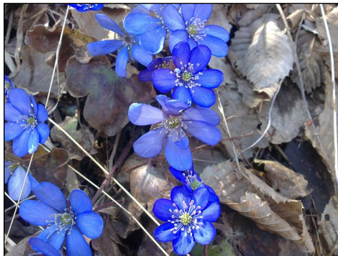
Slika 8. Hepatica nobilis (Zahirović)

Stabljike su uspravne, dlakave, crvenosmeđe boje, visoka do 15 cm. Podanak je kratak, razgranat, horizontalan ili ukošen, tamnosmeđe boje. Čistovi su skupljeni u rozeti, a nalaze se od 5-15 cm dugim peteljka, koje su dlakave. Cvjetovi su pojedinačni, dvospolni, prečnika od 1,5-2,5 cm, sastavljeni od 6-10 ovalnih listića, plavkaste do ljubičaste boje. Cvate u martu i aprilu. Plod je jednosjemeni oraščić, dug oko 3 mm.