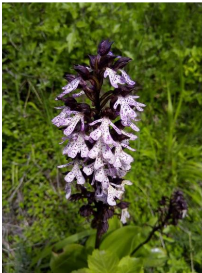
Slika 29. Orchis purpurea (Zahirović, 2018)

Trajna, zeljasta biljka. Stabljika je uspravna, vitka, visoka 30-80 cm. Gomolji su jajoliki sa brojnim debelim, valjkastim korijenima. Prizemni listovi su široko eliptični, dugi oko 20 cm, široki od 2-7 cm, tamnozeleni i sjajni, bez mrlja, a na naličju su svjetliji. Cvjetovi su dvospolni, nepravilni, mirisni, do 50 skupljeno u duguljaste jajaste cvatove dužine do 25 cm. Cvate u maju i junu. Plod je tobolac koji sadrži mnogo malih sjemenki.