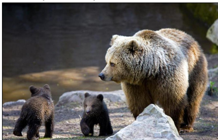
Slika 34. Ursus arctos

Smeđi medvjed ima zdepasto tijelo koje završava kratkim repom, šiljatu njušku, zaobljene uši i oštre zube. Može odvući plijen težak 300 kilograma. Po prehrani je svaštojed. Hrani se drugim životinjama (kukcima, ribama, strvinom i malim sisavcima) jagodama i travom, a katkad i većim životinjama. Smeđi medvjedi teže od 150 kg. Prosječni teritorij svake jedinke iznosi 250 kvadratnih km, a ove životinje vode usamljenički život.