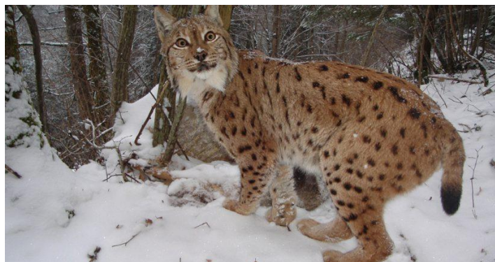
Slika 36. Lynx lynx

Zajednička karakteristika risova su da su im uši šiljaste sa čuperkom dlake na vrhu. Dosežu dužinu tijela (od vrha njuške do početka repa) do 130 cm, a rep je dugačak od 11 do 25 cm, dok su u ramenima visoki 65 cm. U srenjoj Evropi mogu imati težinu od 20 do 26 kg (krajnje vrijednosti su od 12 do 27 kg). Krzno im je žućkasto do sivo smđe i prošarano tamnijim pjegama ili prugama.