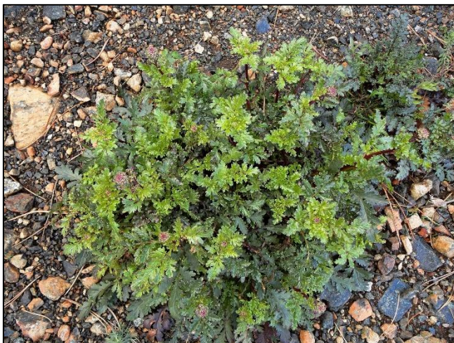
Slika 13. Scrophularia tristis (Šarić, 2018)

Dvogodišnja biljka tankog korijena. Stabljike su visoke oko 20-60 cm, uspravne; naviše od sredine prelaze u usku metlicu. Listovi su skoro gotovo perasto izdijeljeni, sa širokom režnjevima, oštro nazubljeni. Cvjeta u maju i junu, ponekad i u julu. Cvjetići su pojedinačni, na kratkim žljezdastim drškama, koje su kraće od čašice. Krunica je duga 3-4,5 mm. Plod ove zijačice je okruglasta čahura, duga oko 5 mm u kojoj je veći broj crnkastih sjemenki.