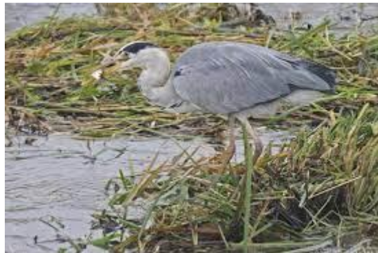
Slika 38. Ardea cinerea

Siva čaplja je velika ptica, visoka do 100 cm (40 in) i duga 84-102 cm (33-40 in) s rasponom krila od 155-195 cm (61-77 in). Tjelesna težina može varirati od 1,02 do 2,08 kg (2 lb 4 oz – 4 lb 9 + 1/4 oz). Perje je uglavnom pepeljasto sivo odozgo, a odozdo sivkasto-bijelo s nešto crne boje na bokovima. Odrasli imaju glavu i vrat bijele boje sa širokim crnim supercilijem koji završava vitkim, visećim grebenom i plavkasto-crnim prugama na prednjoj strani vrata. Lopato perje je izduženo, a perje u podnožju vrata također je nešto izduženo. Nezrele ptice nemaju tamnu prugu na glavi i općenito su dosadnijeg izgleda od odraslih, sa sivom glavom i vratom i malim, tamno sivim grebenom.