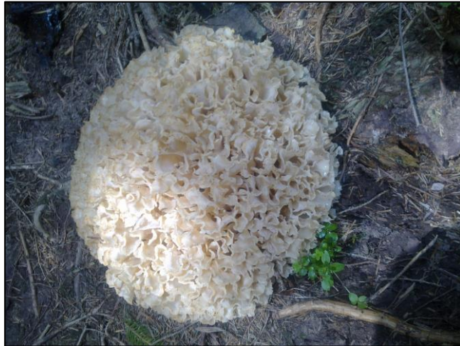
Slika 42. Sparassis nemeci (Janjoš, 2018)

Plodište je veličine do 40 cm, žućkasto-kremaste je boje, grmoliko i razvija se iz zajedničke osnove sa mnogo sitnih, nekad spojenih latica na vrhovima ogranaka. Javlja se u jesen na starim stablima jele ili panjevima, uzročnik smeđe truleži na stablima.