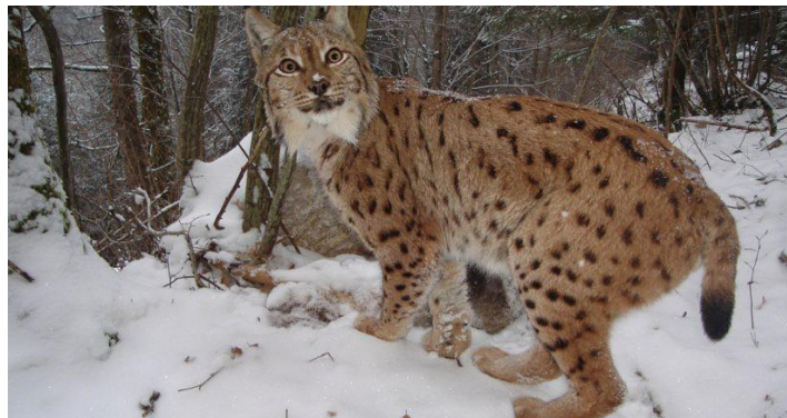
Slika 33. Lynx lynx

Zajednička karakteristika risova su da su im uši šiljaste sa čuperkom dlake na vrhu. Dosežu dužinu tijela (od vrha njuške do početka repa) do 130 cm, a rep je dugačak od 11 do 25 cm, dok su u ramenima visoki 65 cm. U srenjoj Evropi mogu imati težinu od 20 do 26 kg (krajnje vrijednosti su od 12 do 27 kg). Krzno im je žućkasto do sivo smđe i prošarano tamnijim pjegama ili prugama.