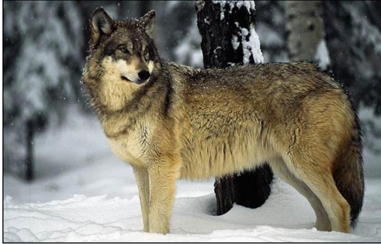
Slika 32. Canis lupus

Veličina i težina vukova se jako razlikuje jer nastanjuju vrlo velika i različita područja. Dosežu dužinu tijela (od vrha njuške do početka repa) do 160 cm, a rep je dugačak još do 52 cm. U ramenima je visok oko 80 cm a mogu doseći težinu do 80 kg.