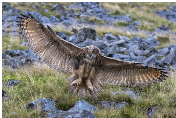
Slika 35. Bubo bubo

Voli stare listopadne i crnogorične šume, stepe, polupustinje, mokre i suhe ravnice i kamenjare.