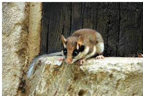
Slika 37. Eliomys quercinus

Vrtni puhovi su obično dugi od 10 do 15 cm, a teški su od 60 do 140 g. Krzno im je sivo ili smeđe osim bijelog trbuha. Vrtni puh se može prepoznati po crnim mrljama oko oka, relativno velikim ušima, kratkoj dlaci i bijelom kraju repa.