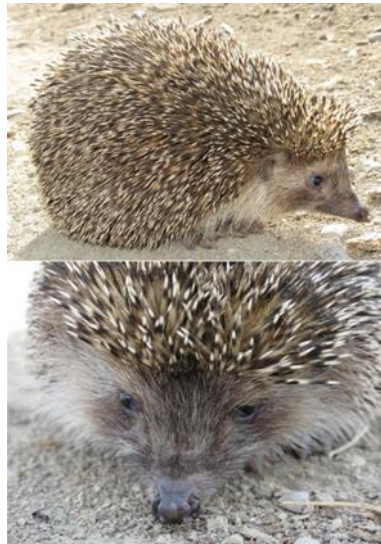
Slika 36. Erinaceus concolor

Po načinu života i izgledu vrlo je sličan europskom ježu ( E. europaeus ), ali prvi ima bijelu mrlju na prsima. Može narasti do 225 - 275 mm u duljinu i težiti 400 do 1100 g, a vrlo je slično tamnoprskom ježu. Najveća je razlika što ima svjetlija prsa. Za razliku od svog europskog kolege, južni bijeloprsi jež nikada ne kopa jazbine. Preferira izgradnju gnijezda na travi na osamljenim mjestima.