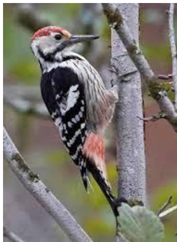
Slika 39. Dendrocopos leucotos

To je najveći pjegavi djetlić na zapadnom Palearktiku, dugačak 24–26 cm s rasponom krila 38–40 cm. Perje je slično velikom pjegavom djetliću, ali s bijelim prugama preko krila, a ne pjegama, i bijelim donjim dijelom leđa. Mužjak ima crvenu krunu, a ženka crnu. Bubnjanje mužjaka je vrlo glasno, pozivi uključuju tihi kiuk i duži kweek.