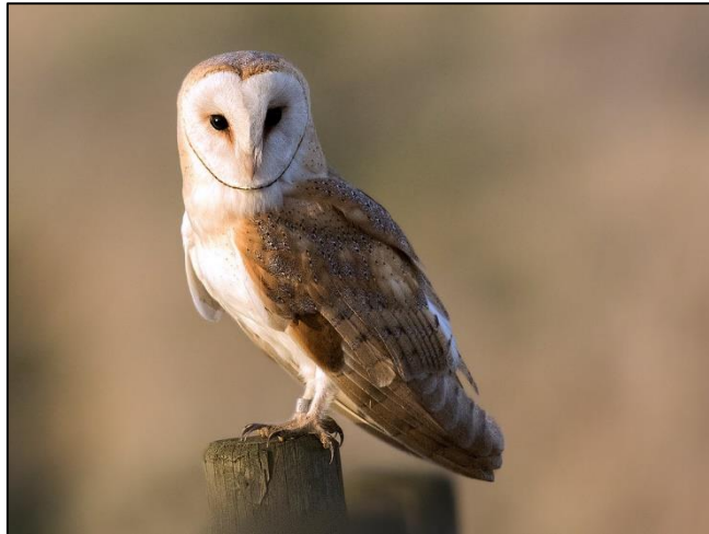
Slika 30. Tyto alba

Kukurvija, kao i sve sove, ima veo oko očiju, kojeg čini radijalno raspoređeno perje. Kod ove je vrste je taj veo bijel i srcastog oblika. Kukurvija je srednje veličine, a sa nogama je duga oko 35 cm. Ženke su krupnije od mužjaka, a prosječna težina im iznosi oko pola kilograma. Leđa su joj narančastosiva sa sivim točkama, a donja strana bijela.