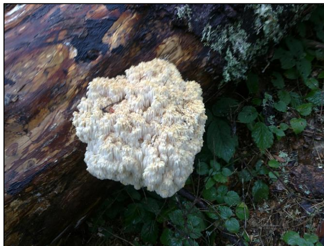
Slika 41. Hericium coralloides (Zahirović, 2018)

Plodište je veličine do 30 cm, koraloidno razgranato iz zajedničke osnove. Izraštaji međusobno nepravilno isprepleteni i tanki, na kraju sa čupercima visećih iglica. Plodište je u početku bjeličasto-kremaste boje, a kasnije žućkast do ružičast. Javlja se od ljeta do kasne jeseni na mrtvim stablima jele ili panjevima.